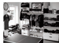
Tisch zum Testen